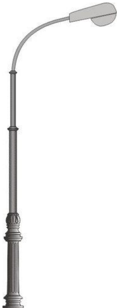
Столб фонарный Высота: 3,0-4,5 м

2. Обеспечение освещения дворовых территорий